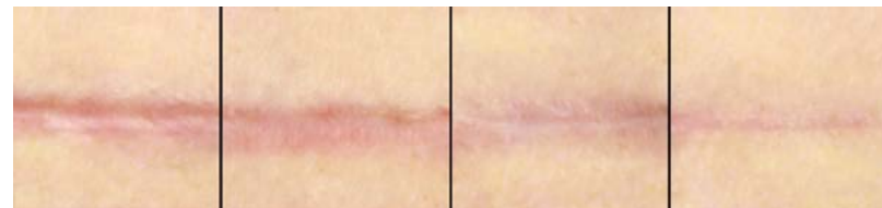
Slika: Pričakovano brazgotinjenje od 1 meseca do 3 let po operaciji

Pomembno je, da prvo leto po operaciji brazgotin ne izpostavljate soncu ali obiskujete solarija . Če so brazgotine na izpostavljenih predelih kože, jih je nujno treba zaščititi s sončno kremo s SPF vsaj 30 ali obližem.